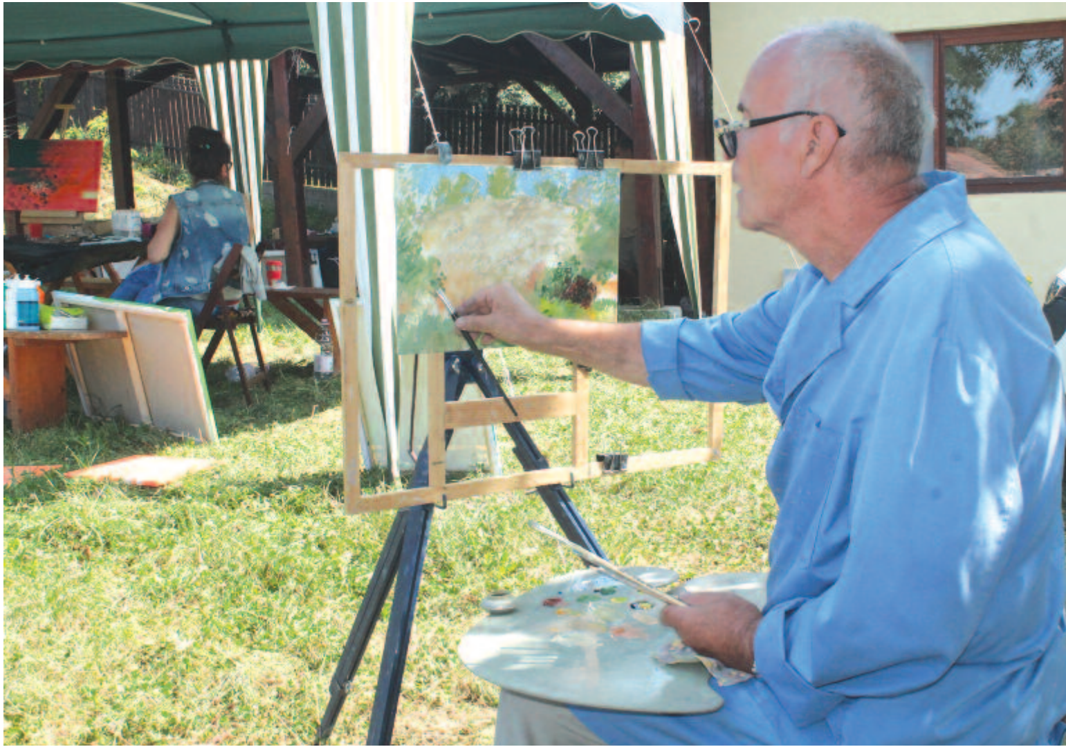
Mezőmadarasi Népszerűség a 6. oldalon