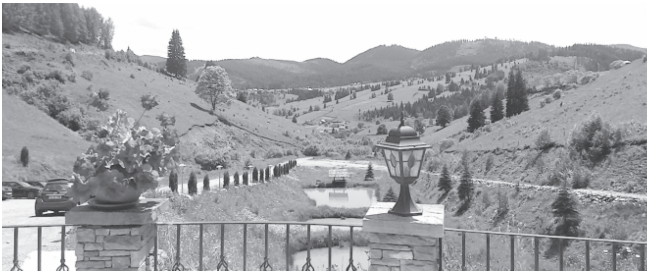
Dornavára vonzó turisztikai célpont

rizmustípusok, illetve a látnivalók kategóriái szerint” – hangsúlyozza a közlemény. A szaktárca ugyanakkor rámutat, hogy egy új népszerűsítő kisfilmet is készítenek a versenyképes hazai turizmustípusokról. A minisztérium közleménye arra is kitér, hogy hétfőn és kedden szemináriumot tartanak Bukarestben a digitális turizmusról. Az eseményt a szaktárca szervezi az izraeli turisztikai minisztérium támogatásával. (Agerpres)