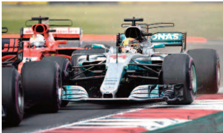
Már az első körben eldőlt, hogy Vettel nem nyer futamot Olaszországban: Hamilton a külső íven haladva megpróbálta megelőzni a német pilótát, ám a kanyarba befordulva a két autó összeért, a Ferrari pedig megpördült, de ami súlyosabb, meg is sérült, így ki kellett cserélni az orrkúpját, ezzel pedig nagyon sok időt veszített

* csapatok: 1. Mercedes 415 pont, 2. Ferrari 390, 3. Red Bull 248, 4. Renault 84, 5. Haas 84, 6. McLaren 52, 7. Toro Rosso 30, 8. Force India 28, 9. Sauber 19, 10. Williams 5