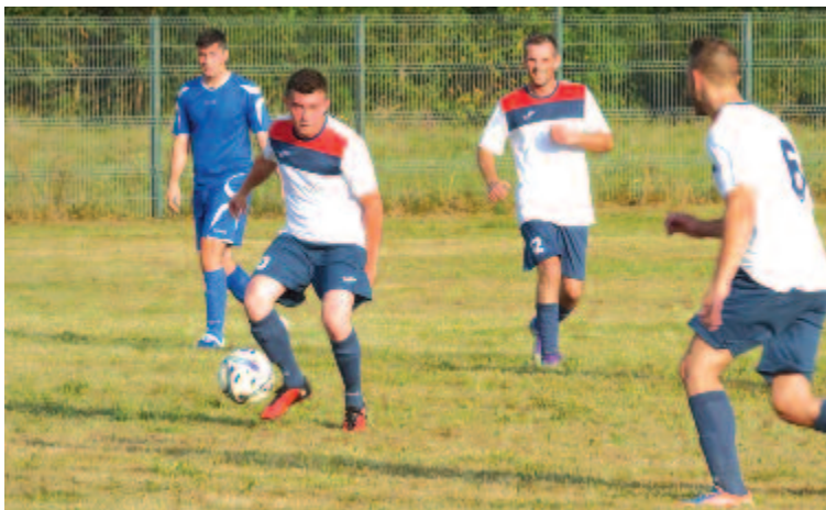
Csíkfalva emberhátrányban is tartani tudta az iramot a bajnok Nyáradremetével